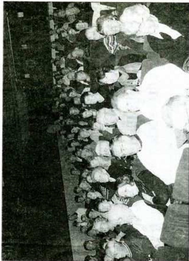
Un public nombreux et chaleureux

Le temps de déguster café et pâtisseries « maison » réalisées par les membres et sym-